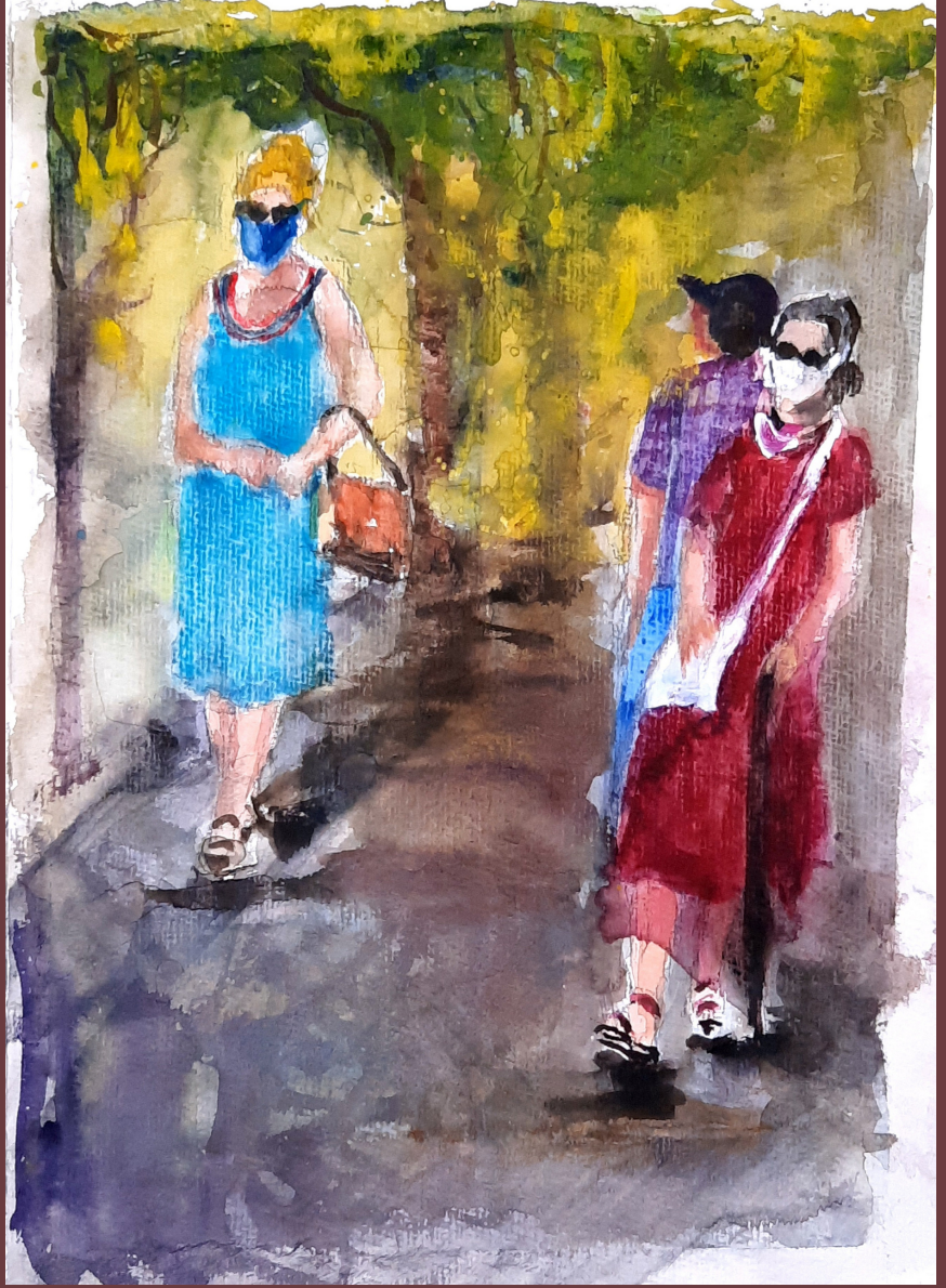
Yeni Hayat Düzeni, kağıt üzerine akrilik ve sulu boya, 25 x 17 cm