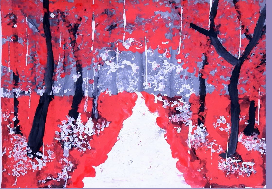
Peyzaj Çalışması, kağıt üzerine guaj boya, 25 x 35 cm