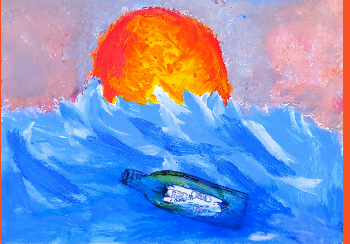
Şimdi Hayat, Covid 19'un Yolculuğu, kağıt üzerine pastel boya ve akrilik boya, 35 x 50 cm