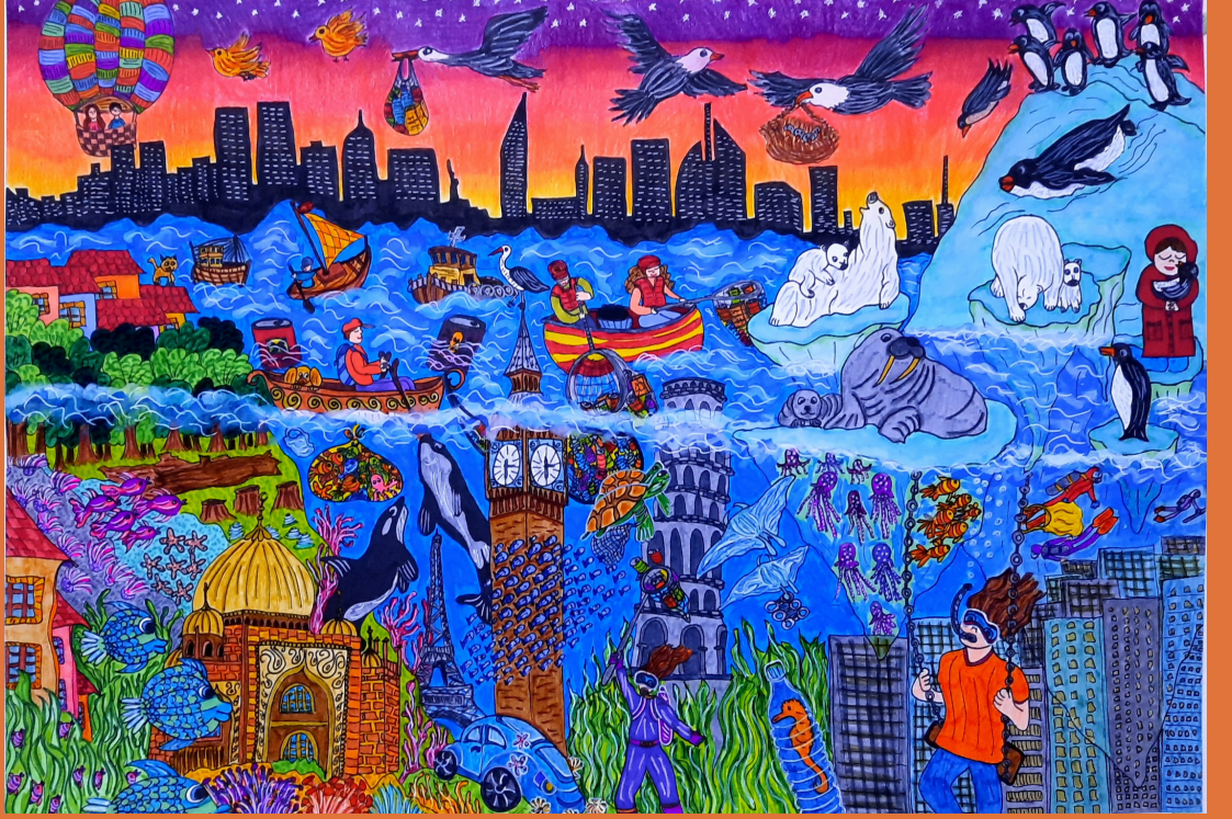
Sular Yükselirken, kağıt üzerine karışık teknik, 35 x 50 cm