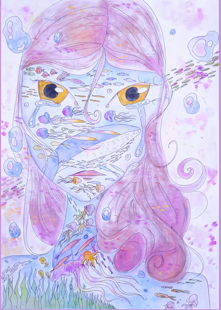
Akdeniz, kağıt üzerine sulu boya, 50 x 35 cm