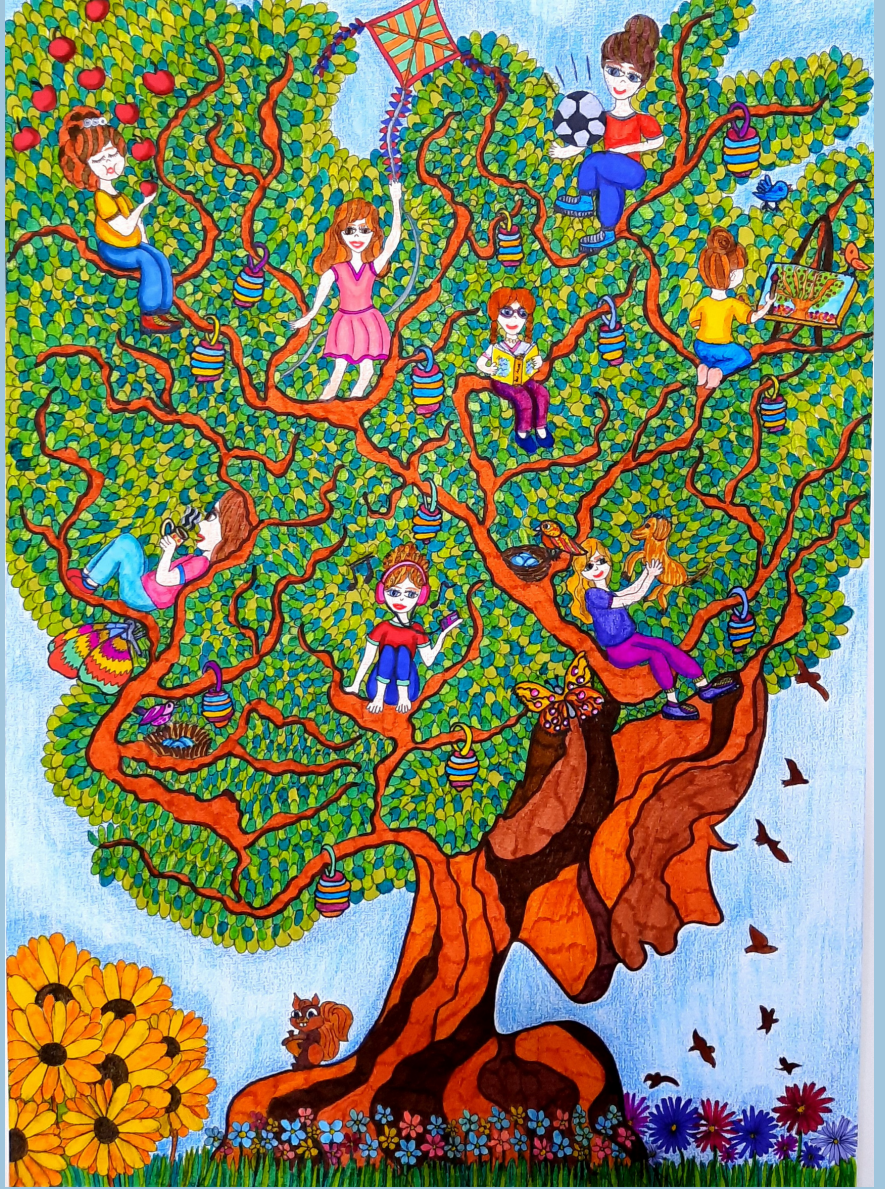
Hayat Ağacı, kağıt üstüne karışık teknik, 35 x 50 cm