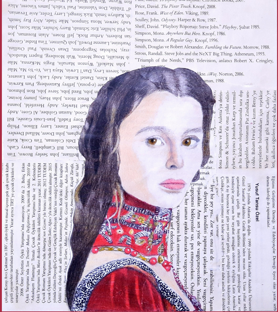
Son Bakış, kağıt üzerine karışık teknik, 21 x 24 cm