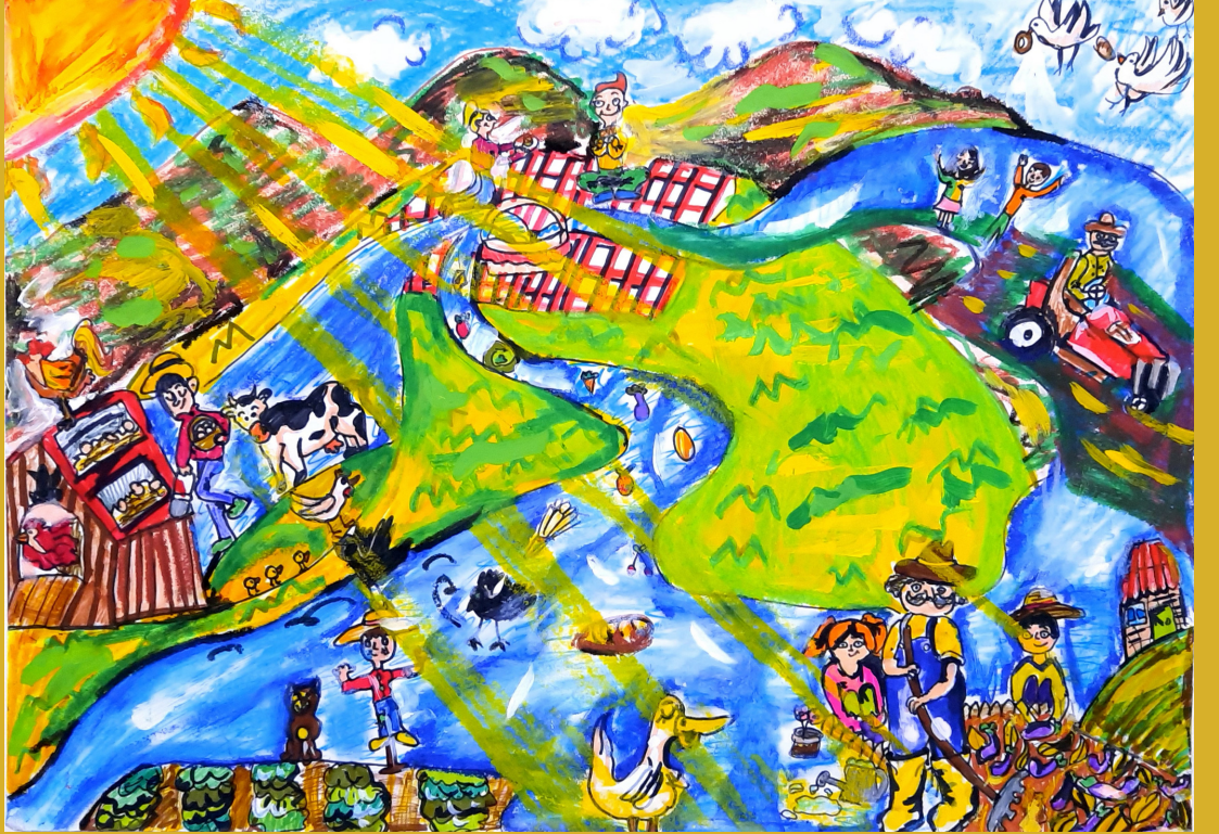
Çiftlikte Hayat, kağıt üzerine pastel boya ve keçeli kalem, 35 x 50 cm