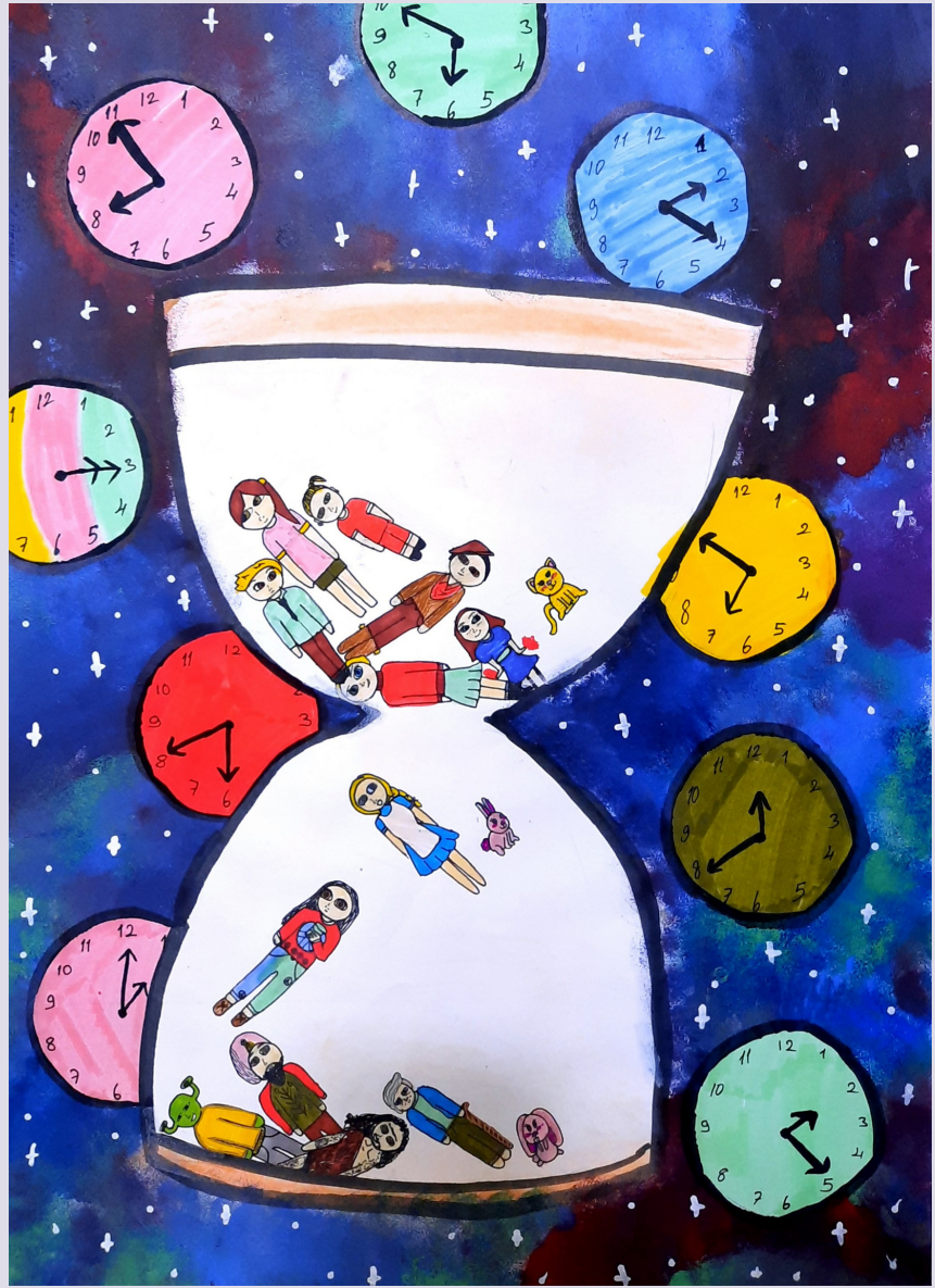
Zamanda Akan Yaşamlar, kağıt üzerine karışık teknik, 48 x 34 cm