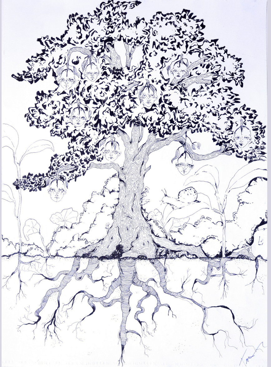
Rüya Ağacı, kağıt üzerine siyah pilot kalem, 50 x 35 cm