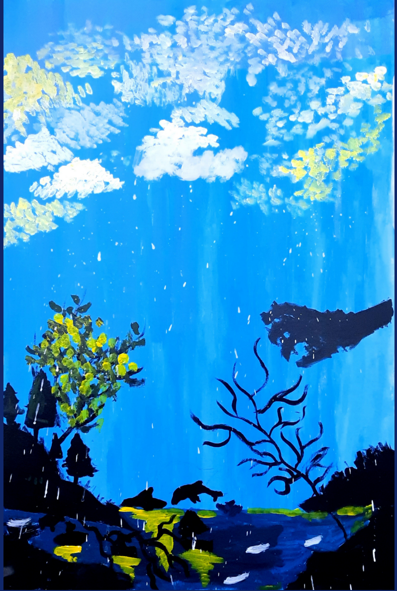
Hayatın Anlamı, tuval üzerine akrilik boya, 35 x 50 cm