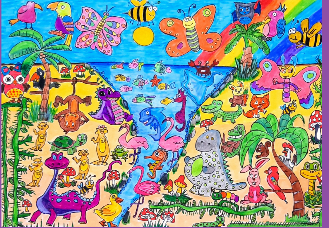
Benim Renkli Dünyam, Hayvanların Özgür Hayatı, kağıt üzerine keçeli kalem, A4