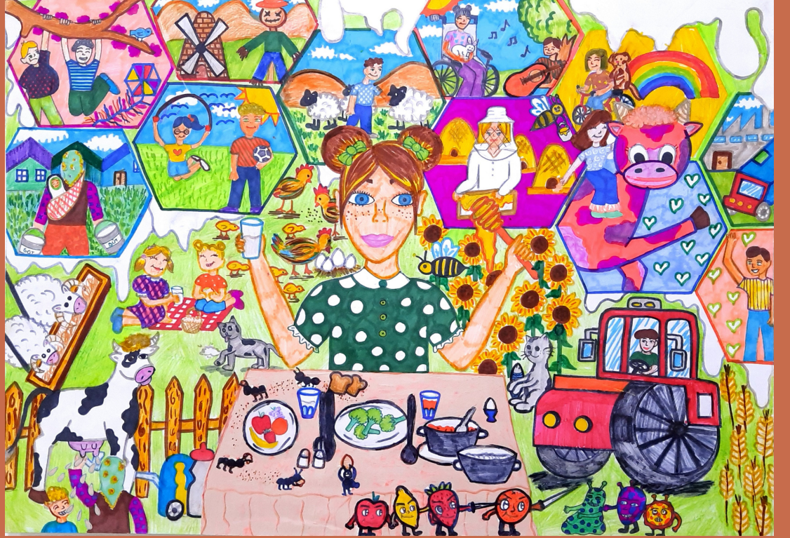
Doğada Mutlu Günler, kağıt üstüne karışık teknik, 35 x 50 cm