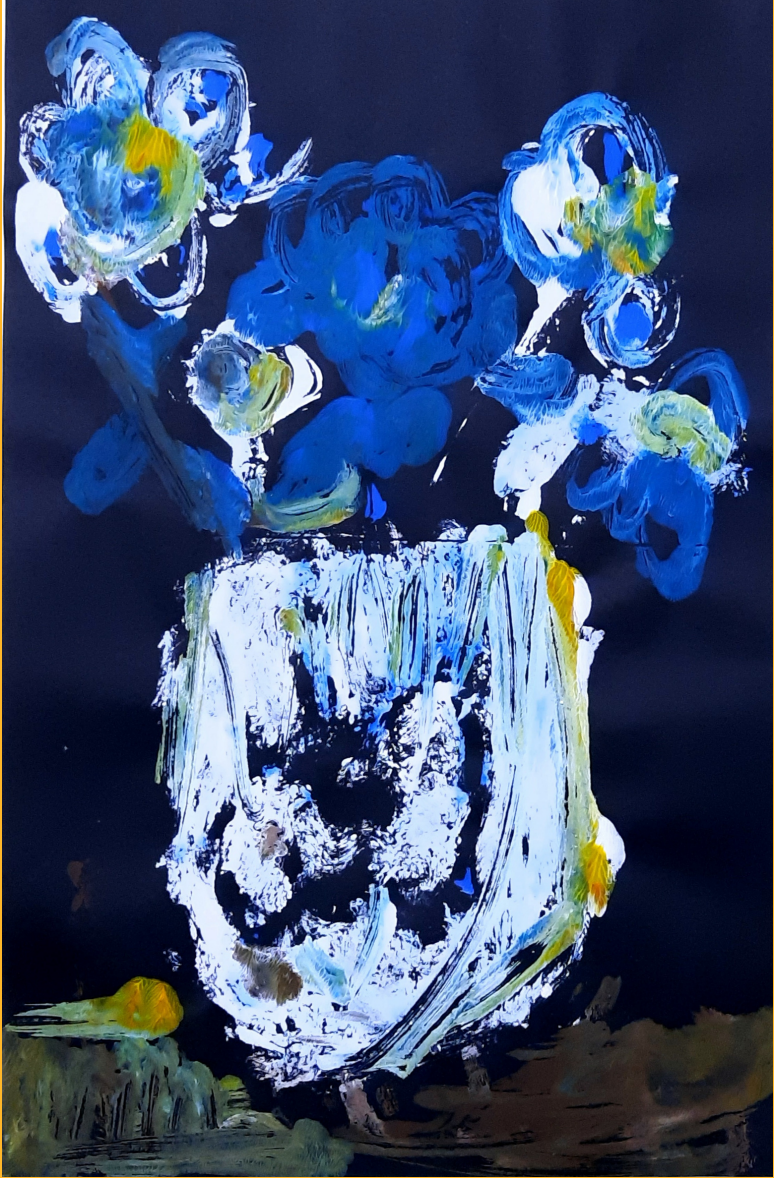
Mavi ve Beyaz, kağıt üzerine akrilik boya, 35 x 50 cm