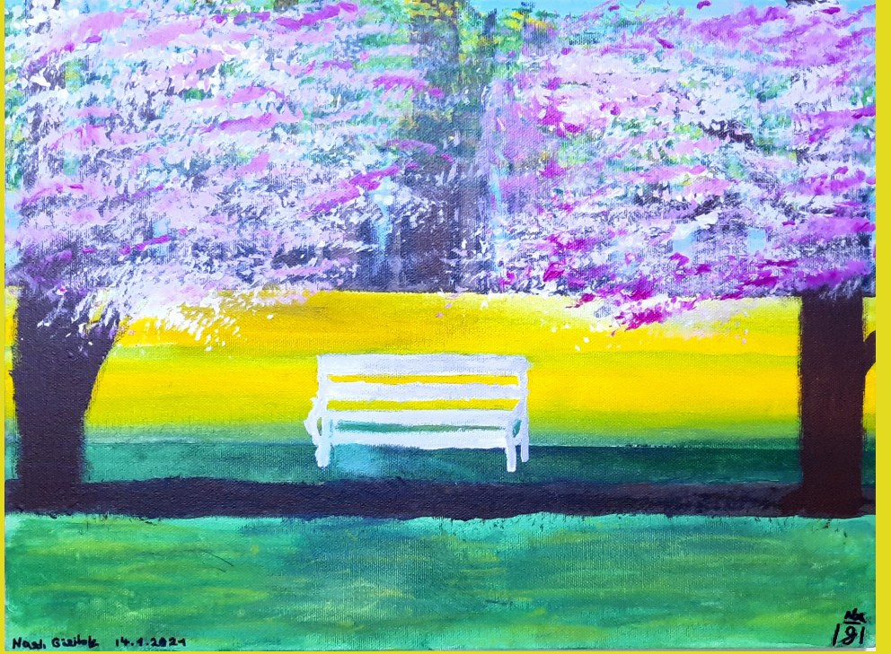
Yalnız Bank, tuval üzerine yağlı boya, 25 x 35 cm